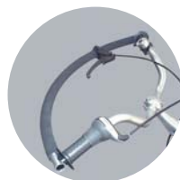
Guidon 1/4 de cercle