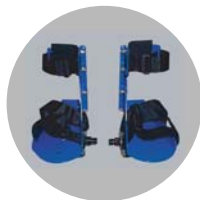
Cale-pieds avec maintien de la jambe