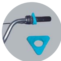
Aide au passage des vitesses