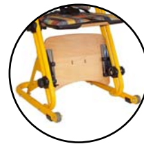
R.P. escamotable 165 921