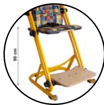
Assise à 90 cm 165 060