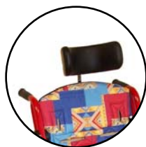
Appui-tête 165 400