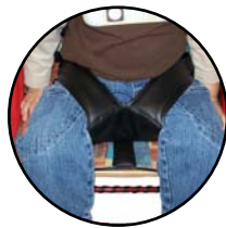
Sangle culotte 165 660