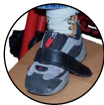
Sangles pieds 165 950