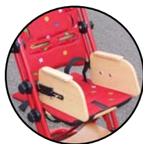
Maintiens réglables 165 725