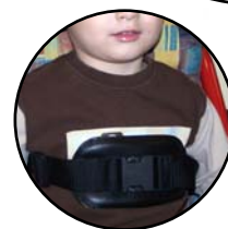
Sangle poitrine 165 520