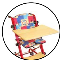
Tablette 165 735