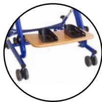
Cales-pieds alu 165 942