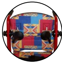
Cales latérales 165 636