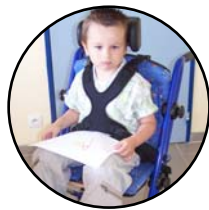
Harnais 165 545