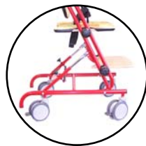
Roulettes Ø125 165 185