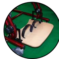
R.P. surbaissé 165 915