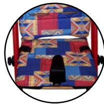
Butée d'abduction 165 612