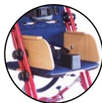
Maintiens fixes 165 720